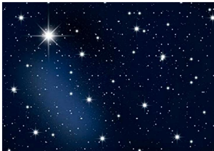
Réserve internationale du ciel étoilé.

L'économie attendue : 40% sur l'éclairage public neutraliserait l'augmentation de tarif.