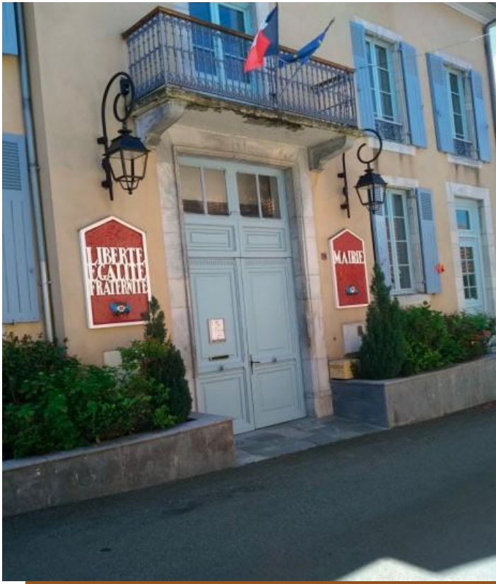
Rénovation façade de la Mairie