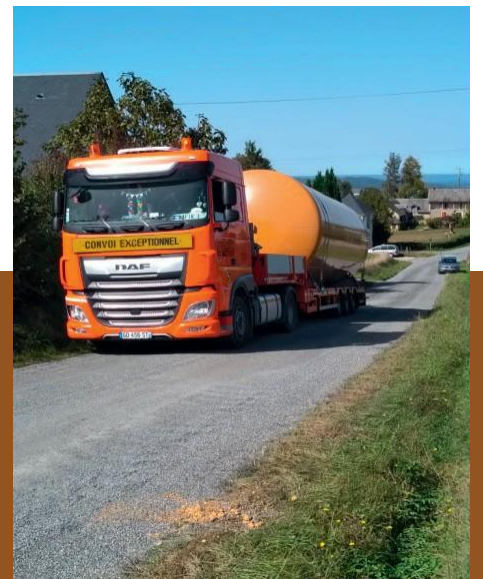
Création d'une réserve d'incendie de 60 m 3 au quartier MARCADIEU