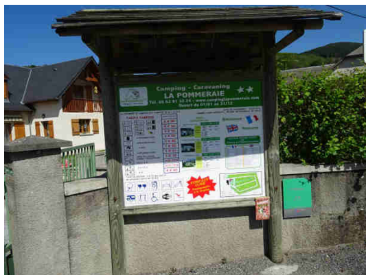
Camping au village