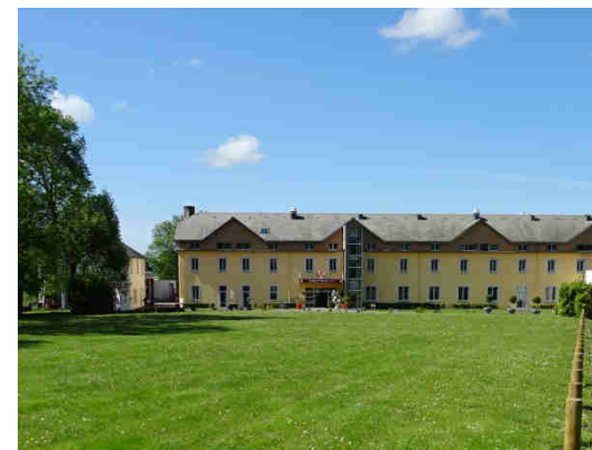
Hôtel Restaurant au bords de l'Adour