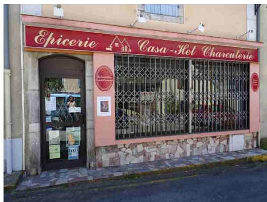
L'épicerie au centre du village