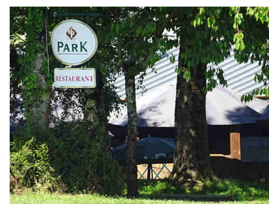
Restaurant au Col des Palomières